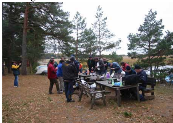
Korv och dricka förtäres efter väl förrättat värv.

planerad blev inte av under sommaren av olika skäl, därför fick presseningen läggas i ordning så att vattnet inte rinner in i sprickan i bunkern. Vi flyttade även in bryggorna på insidan av stora bryggan, Roffe sågade ner två träd, de kapades upp och fraktades bort till huggning. Vi for se om det är