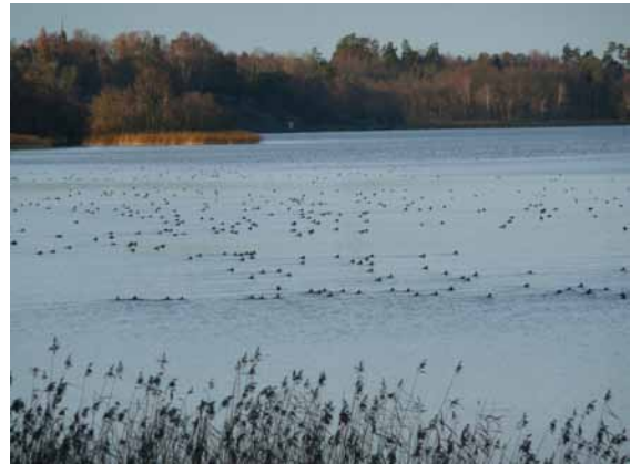
Bild från Notholmen tagen av den kände ornitologen Tommy Carlsson som citeras nedan. ”Några tusen pippijäglar av okänt ursprung vinterbadar mitt emot holmen”.

Ur serien ”Hur gör djur på Notholmen” följer här avsnittet ”Vi gör som alla andra Gun, vi simmar medurs!”