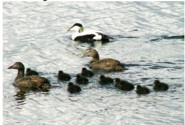
Bigamisten fotograferad ”in flagrante”

Ur samma serie tar vi en bild på en som inte gör som alla andra.